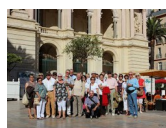
Sortie Sud Est Toulon 20 sept 13