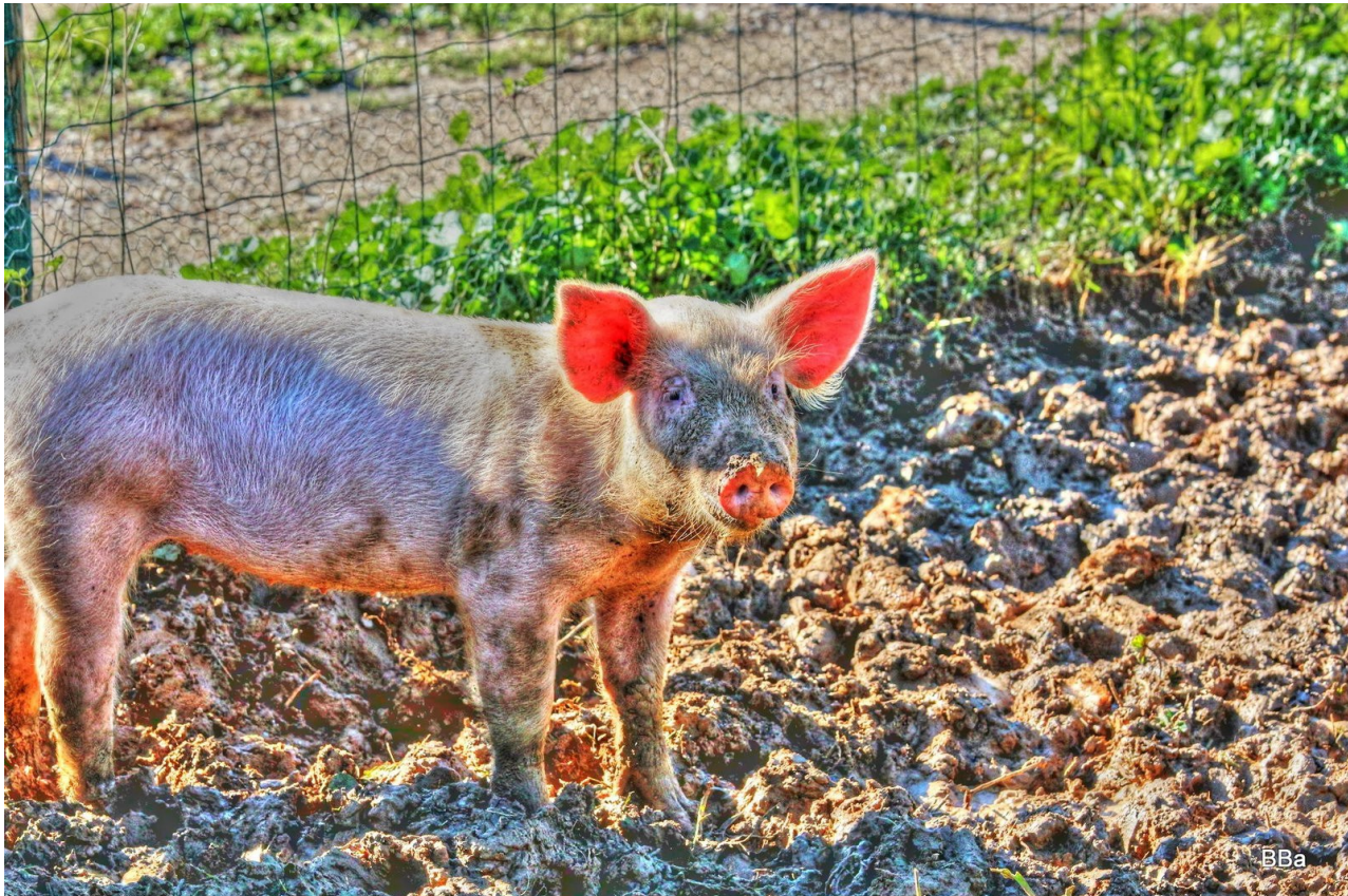
Chapelle St Jean pla de corts Nov 2011