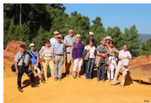
Sortie Sud Est 12 sept 14