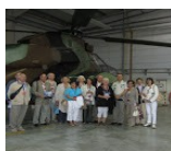
Sortie Sud Est le Luc 21 sept 12