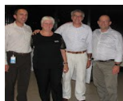
pot M&BBa Oct 2007