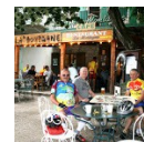
Anciens en action