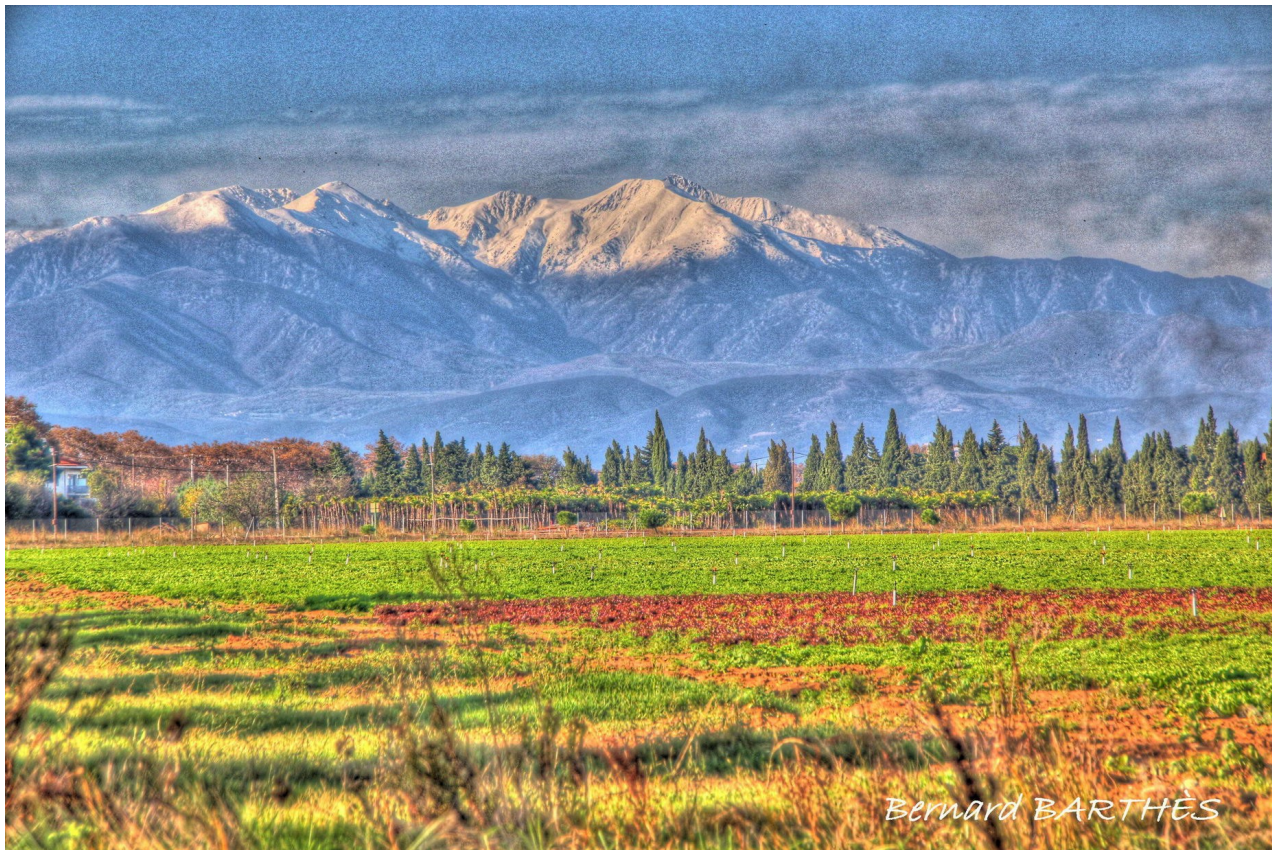
Le Canigou pris de chez moi (ou presque) Alenya Nov 2011 Au passage admirez la végétation locale en Novembre (Salades)

Je vous propose ci-après quelques unes de mes compositions (on aime ou on aime pas, c'est ça la liberté d'expression ..)