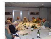
A.A. CGR- GEMS IDF