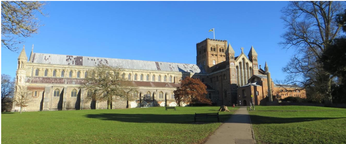
Vue côté sud (à droite et la tour : partie Normande)