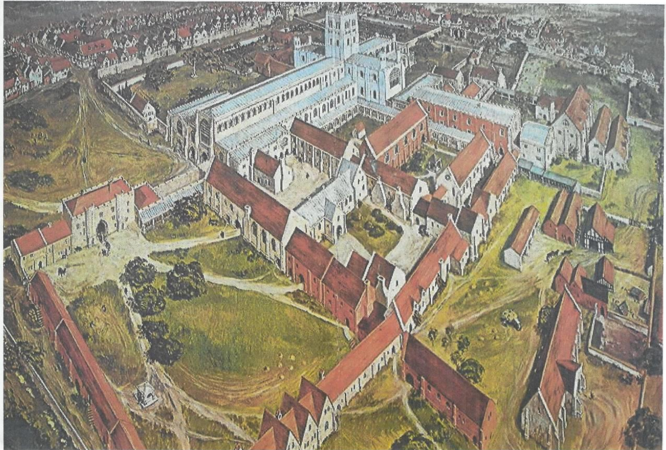
Monastère tel qu'il aurait été juste avant la dissolution

St Albans (Hertfordshire-RU) et son monastère, cathédrale et église.