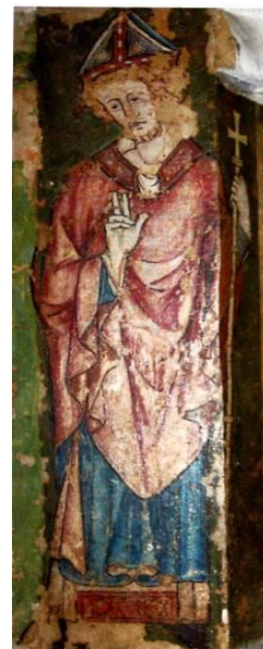
St Guillaume de York